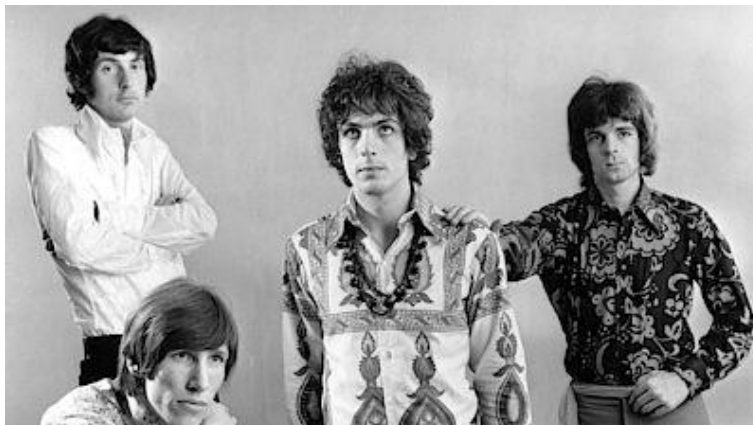
Pink Floyd

Krabice Germin/ation mapuje rok 1968, Dramatis/ation rok 1969, Devi/ation 1970, Reverber/ation 1971 a Opfusc/ation 1972. Poslední díl Continu/ation obsáhne různé rarity z BBC a tři celovečerní filmy The Committee, More a La Vallée.