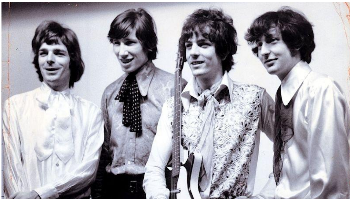
Zleva: Rick Wright, Roger Waters, Syd Barrett a Nick Mason v roce 1967

Na předvánoční trh vtrhnou Pink Floyd v listopadu s největším dárkovým boxem v dějinách této skupiny a možná i jakékoli jiné skupiny. Balíček The Early Years 1965–1972, který obsahuje raritní písně, dema, koncerty, videa a filmy, se skládá z 27 disků.