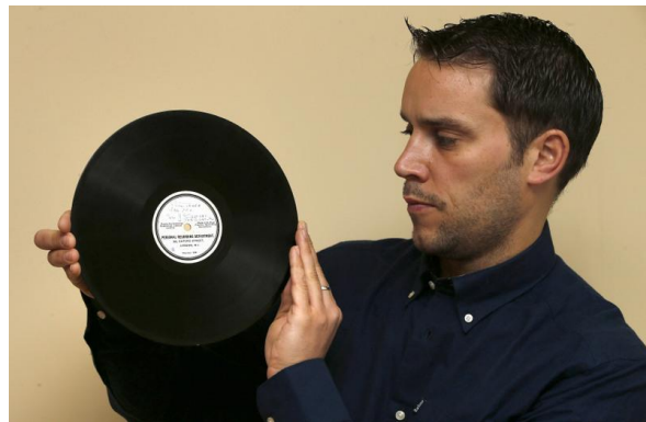
Acetátová deska od Beatles z roku 1962.

Acetátové desky jsou obecně vzácné tím, že od každého alba existuje pouze jeden kus. Memorabilie od Beatles navíc patří dlouhodobě mezi nejvyhledávanější sběratelské kousky. Minulý rok byla Lennonova gibsonka vydražena za 1,7 milionů dolarů a minulý týden se na aukci v Dallasu prodal Lennonův pramínek vlasů , které si musel ostříhat před natáčením filmu, za 24 000 dolarů.