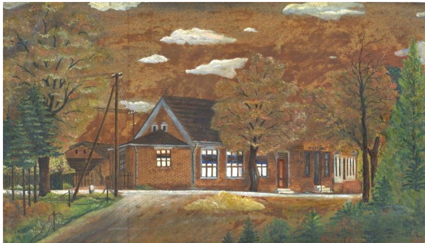
Bernatik kolem r. 1930 – restaurace Na Špici ještě bez omítky