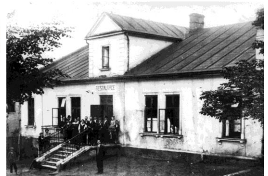
Původní podoba „Cingrova domu“