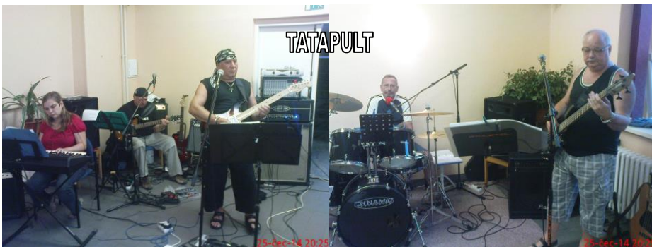
Čtvrtý bubeník Voznica bubnuje