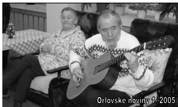
Orlovské noviny 1-2005

kteří se mu posmívali. Přišel o vše, i o svou milovanou kytaru. Tím lze do jisté míry vysvětlit jeho pozdější chování na veřejnosti. Jeho zdravotní stav se prudce zhoršoval, na ulici nepoznával lidi a začal být agresivní. Naštěstí si toho všimli lidé, kteří zařídili léčbu a následné umístění v domě s pečovatelskou službou v Orlové – Lutyni na 5. etapě. Na popud redakce orlovských novin se našlo několik dárců nepotřebných kytar a tak znovu mohl hrát, tentokrát spolubydlícím. Ti na něho dodnes rádi vzpomínají. Dokonce v Orlovských novinách o něm vyšel článek i s fotografií, na které je zachycen, jak hraje obklopen důchodci. V domovince před několika lety taky zemřel.