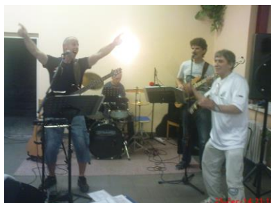
Bubnovalo se i na láhev od piva