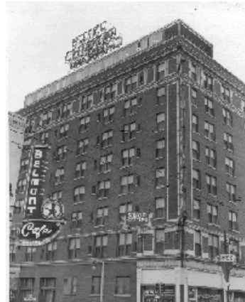
The Hotel Chisca