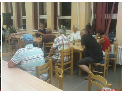
Část hostů sleduje koncert