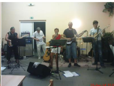
Zoja si taky přišla ne své