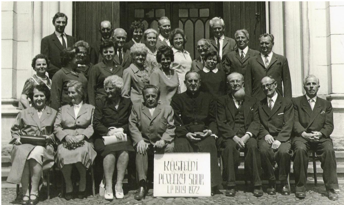
53. výročí chrámového pěveckého sboru 1919 – 1972. Před tímto datem musel být jiný sbor.