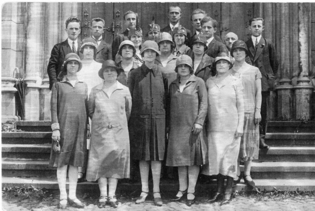
Chrámový pěvecký sbor, nejstarší známá fotografie ( kolem roku 1925 ).

Byl nejvýznamnější postava v historii Orlovského chrámového sboru. Narodil se 19. září 1920 v Orlové. Studoval na Brněnské konzervatoři hru na varhany, sbormistrovství a operní zpěv, bydlel v rodině Leoše Janáčka. V Orlově působil v letech 1940 – 1975 jako ředitel kůru a varhaník. K funkci regenschoriho patřila i hřbitovní správa. S orlovským chrámovým sborem nastudoval spolu s pozvanými špičkovými sólisty náročná hudební díla jako např. Verdiho Requiem, Mozartovy mše aj. Byl léta také sbormistrem opery v Ostravě, zakladatelem a sbormistrem sboru Čs. rozhlasu v Ostravě a Filharmonického sboru Ostrava. Byl rovněž sbormistrem mnoha amatérských sborů, vedl mj. ženský pěvecký sbor Orlová a také vyučoval na gymnáziu v Orlové. Příležitostně sám taky skládal hudbu. Od roku 1975 až do své smrti působil jako sbormistr v šenovském kostele. Jeho otec údajně přišel do Orlové z Moravy od Hostýna.