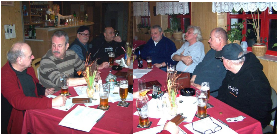
Schůze klubu v novém působišti v restauraci Studánka