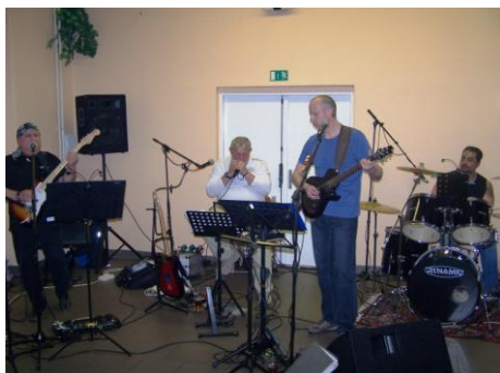
Orlovští bluesmeni v akci.