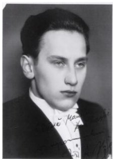
(Snímek z r. 1941)