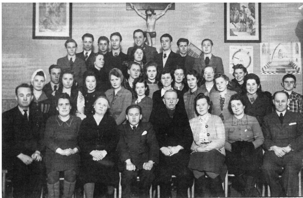
Chrámový sbor – 40. léta.