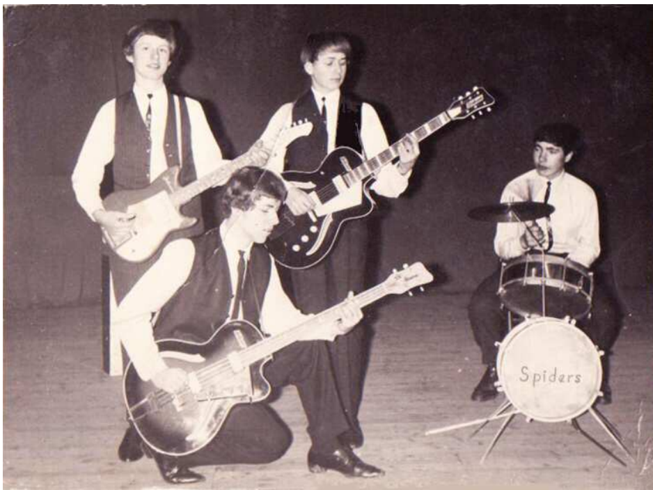
Začátek roku 1964 – hráli v Doubravě v Národním domě