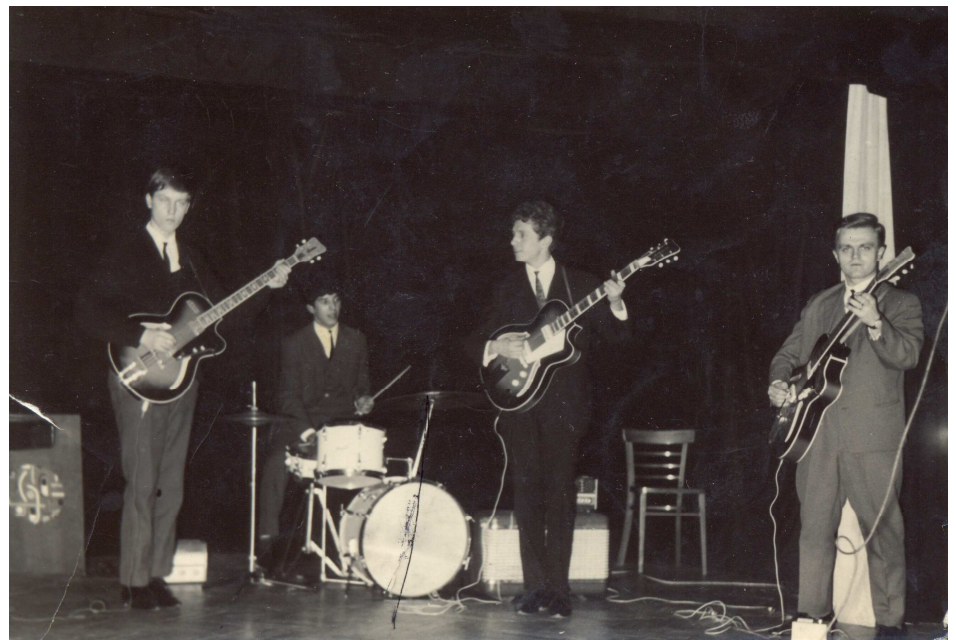
1964 – kapela OU Dolu Čs. Pionýr I Pavko Korčagina v Havířově. (Z vystoupení v Havířově v Bezruči)

Učni často hráli v DK Dolu A. Zápotocký v Lazích a na náborech v celé republice.