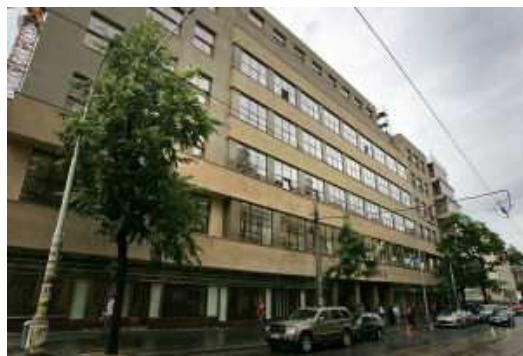
Budova Českého rozhlasu v Praze dnes.