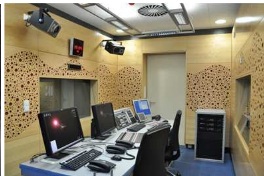
Studio Českého rozhlasu.