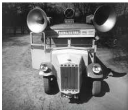
Rozhlasový autobus Tatra z r. 1935.