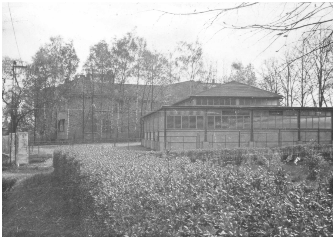
„Skleník“ v pohledu od evangelického kostela. Za ním je vidět bývalou sokolovnu.

Bohužel fotografie skupiny se nezachovala.