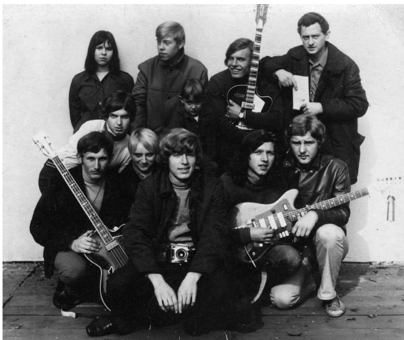
Foto z podzimu 1969 - The Mobs s manažerem a příznivci.

Kapela hrála v restauraci Na Špici na rozhraní Orlové - Poruby, Rychvaldu a Petřvaldu.